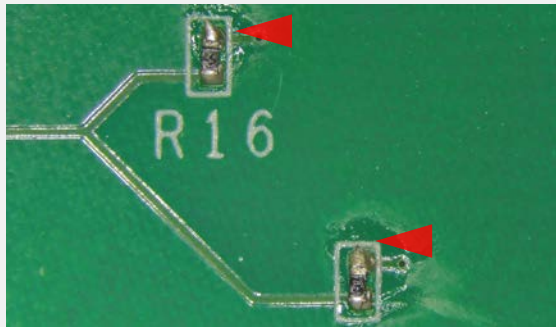
はんだの突起 IPC-A-610G 5.2.10を参照