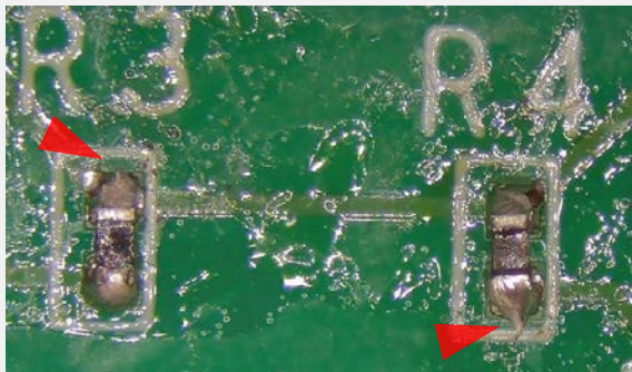
はんだの突起 IPC-A-610G 5.2.10を参照